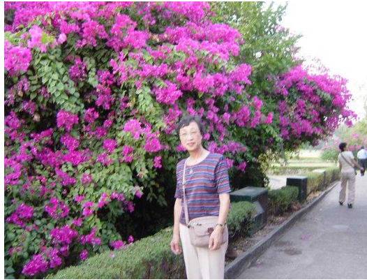
カジュラホのブーゲンビリア