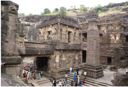
エローラ石窟寺院群

旅行中、世界遺産に登録されている 12 ヶ所を見学することができ、楽しい有意義な旅でした。