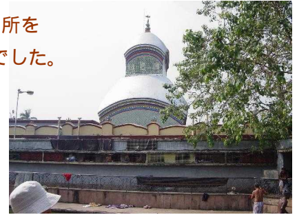
カーリーガート (ヒन्दゥー教の寺院：コルカタ)