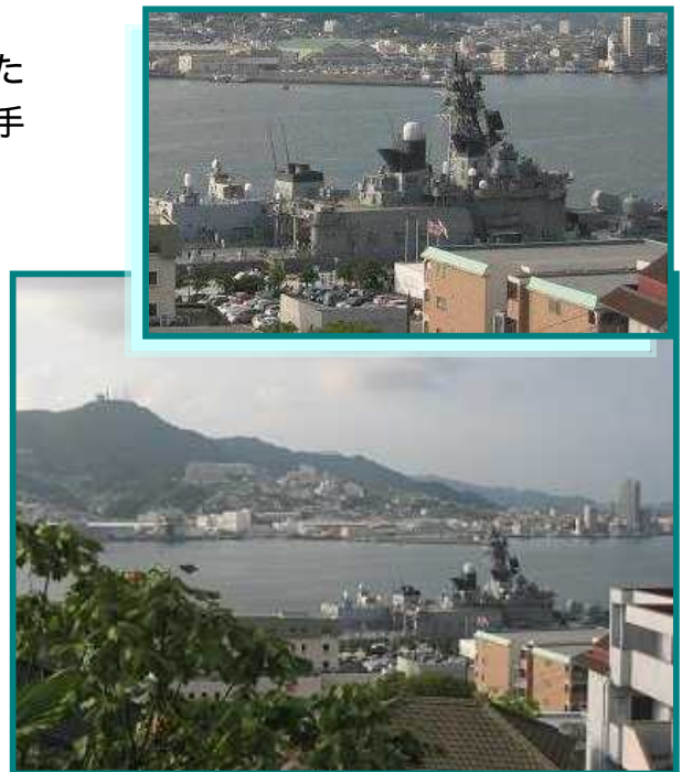
長崎港に停泊中の外国船