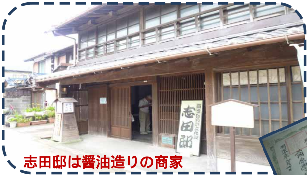
志田邸は醤油造りの商家 卒業証書には平民と記されていた。