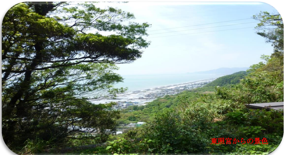
東照宮からの景色