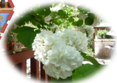
境内のオオデマリの花