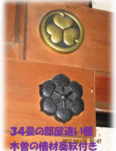
34畳の部屋違い棚 木曾の檜材葵紋付き