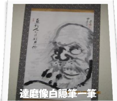
達磨像白隠筆一筆