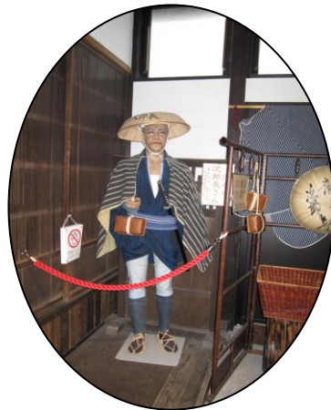
次郎長の等身大の人形