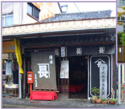
清水次郎長の生家