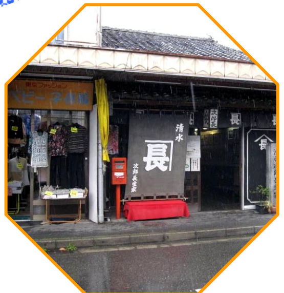
次郎長さんの生家