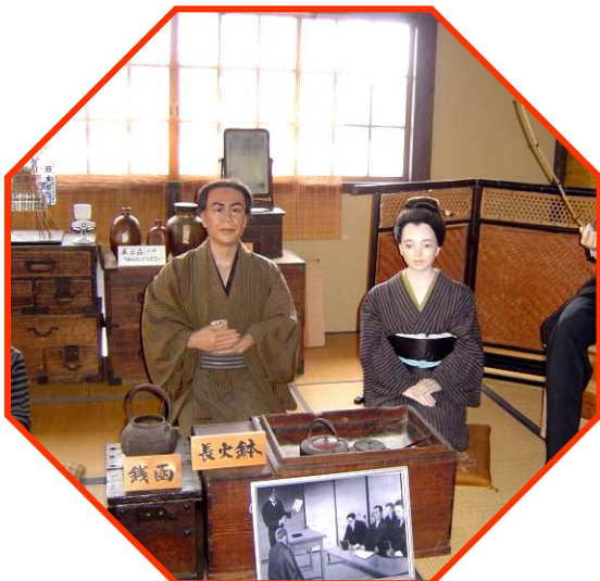
次郎長さんの英語塾