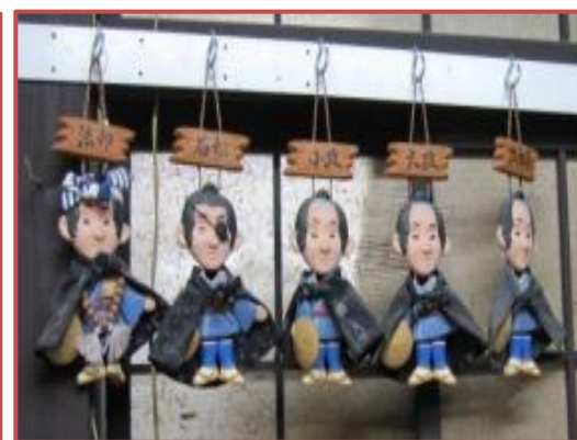
次郎長 五人衆の人形