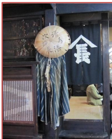
次郎長の笠とカップ