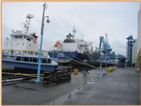
J-オイルミルズ オイルを積んで出港を待つ