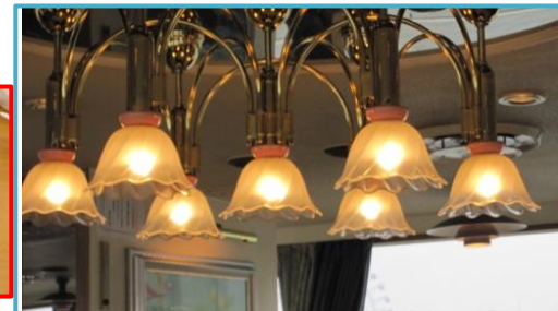
船内のシャンデリア