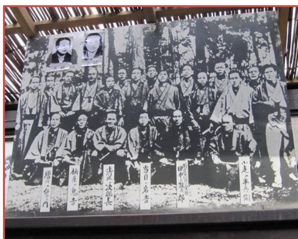
次郎長一家の写真