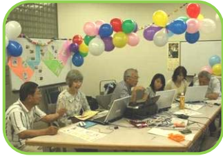
あら!暑中見舞い出来ちゃった

最近、地域での公民館活動や福祉活動の集会で「認知症サポーター養成講座」と云う言葉を耳にします。「認知症サポーター」とは、認知症をよく理解し、地域で認知症の人や家族を暖かく見守り、支援する応援者の事を云います。