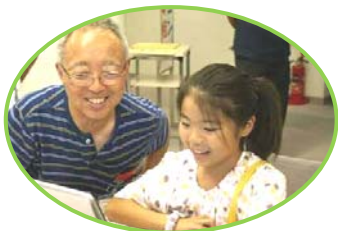
暑中見舞い、どの絵にしようかな

七月二十五日(土)【県民フェスティバル・あざれあメッセ2009】に「パソコン何でも相談」と「暑中見舞いづくり」のテーマで参加し、今年も大好評でした。