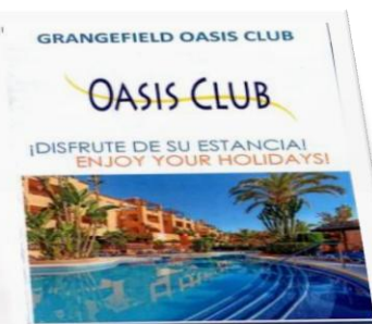
ジョンがメンバーズのホテル 5日間止まる