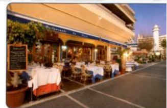
The essence and the flavour of Mediterranean Cuisine