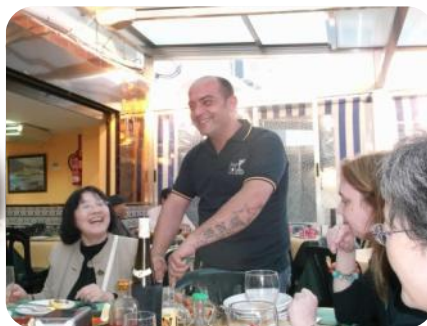
マルベリャの港町のレストランにて